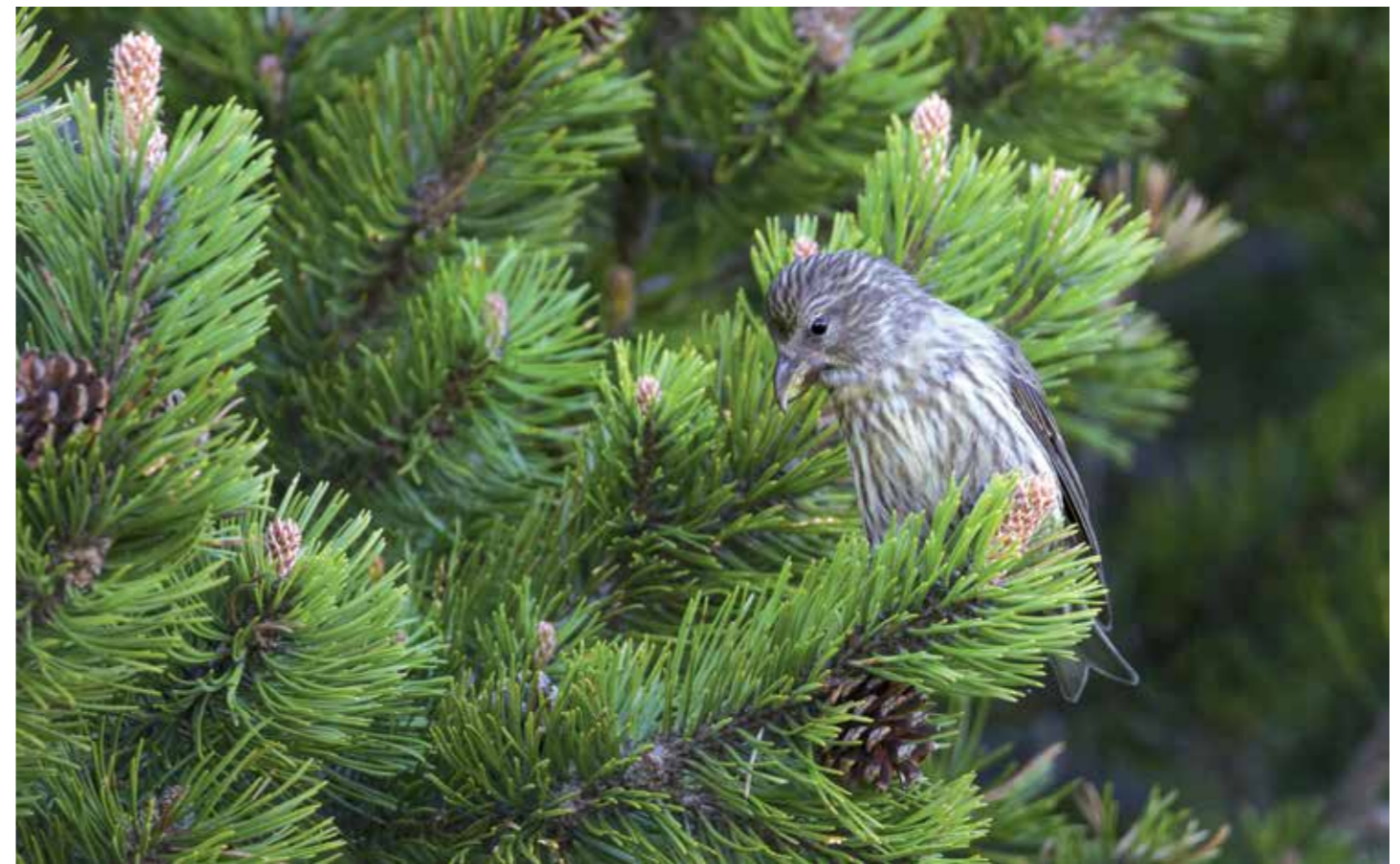
KRUISBEK JONG

De snavel van de kruisbek is uniek en maakt de soort tot een van de meest bijzondere op ons continent. De aparte vorm wijst op een vergaand