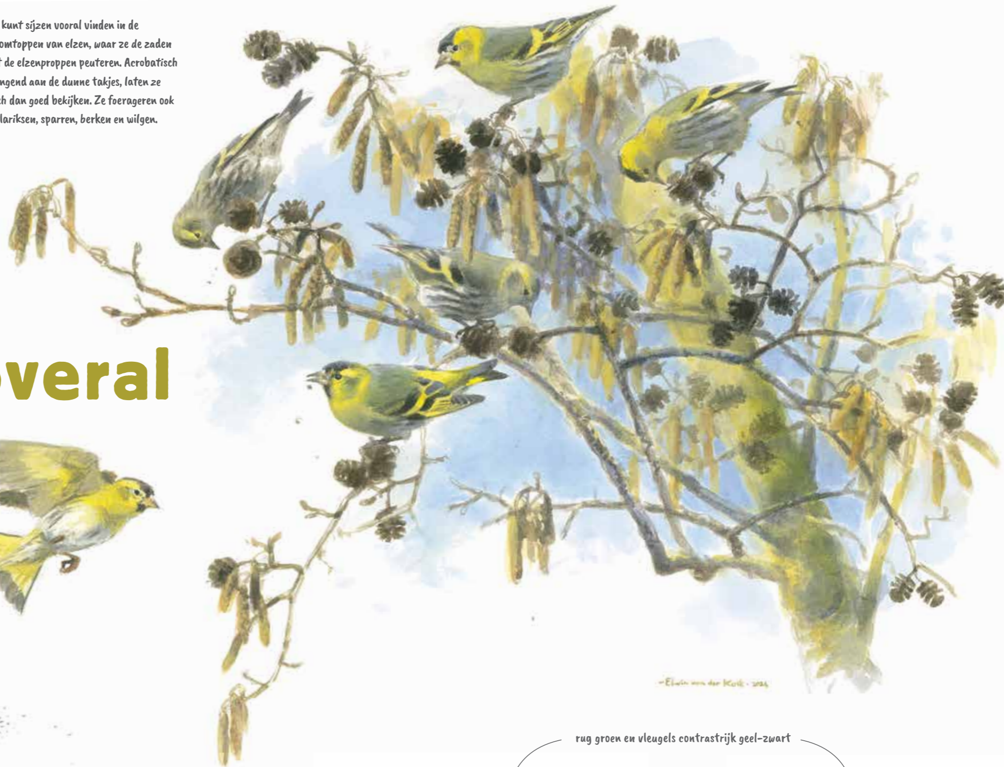
-Elwin van der Kolk - 2014