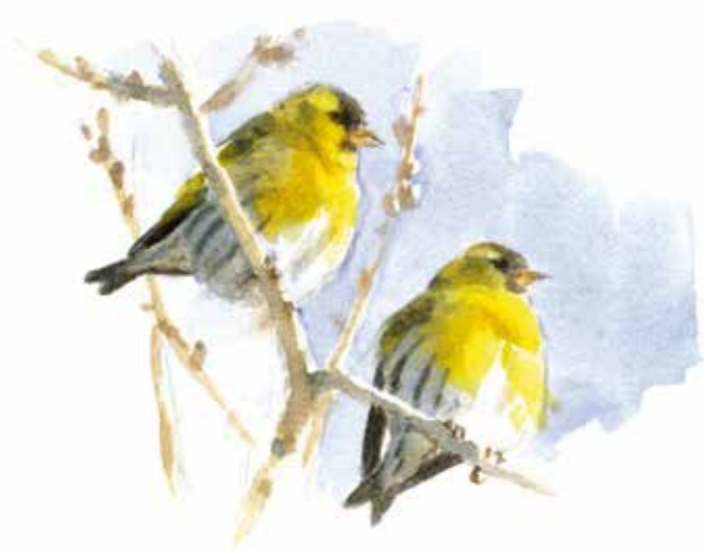
Op zonnige winterdagen zingen ze in koor en kunnen dan behoorlijk luidruchtig zijn.

Je kunt sizen vooral vinden in de boomtoppen van elzen, waar ze de zaden uit de elzenproppen peuteren. Acrobatisch hangend aan de dunne takjes, laten ze zich dan goed bekijken. Ze foerageren ook in lariksen, sparren, berken en wilgen.