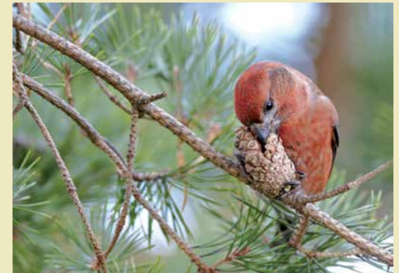
GROTE KRUISBEK

MEER WETEN OVER DE KRUISBEK? Ga naar vogelbescherming.nl/kruisbek .