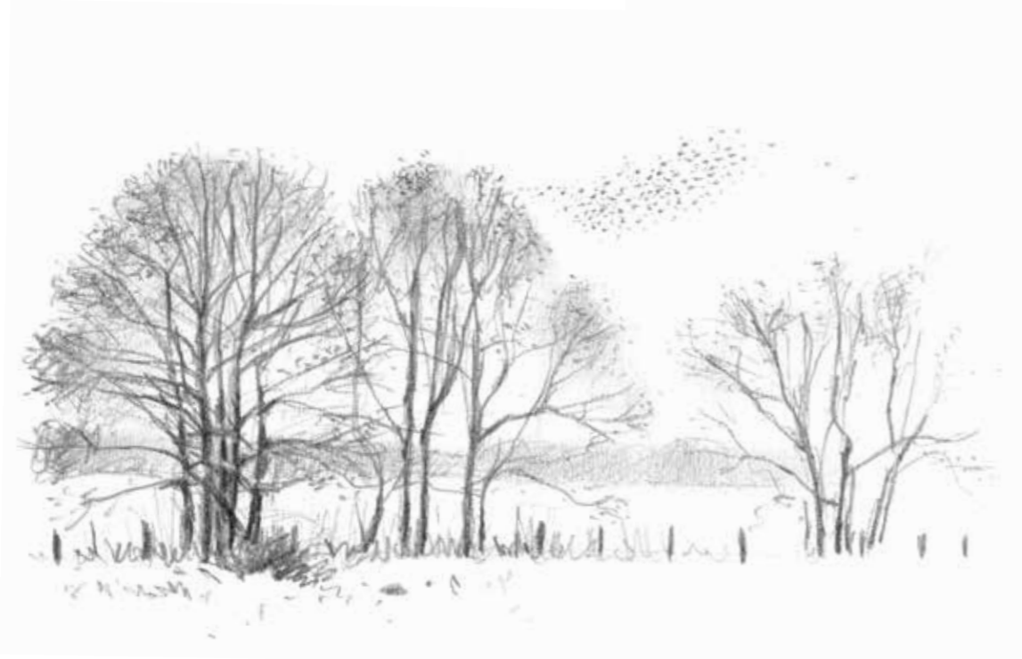
Een wolk sizen bij een elzensingel, met hun kenmerkende, warrelende vlucht.

Met sijsjes zit Nederland iedere winter vol. Ze komen uit Noord- en Oost-Europa bij ons overwinteren. Het is een prachtige, geel-groene vinkensoort, maar relatief onbekend bij velen. Laat ik daar verandering in brengen.