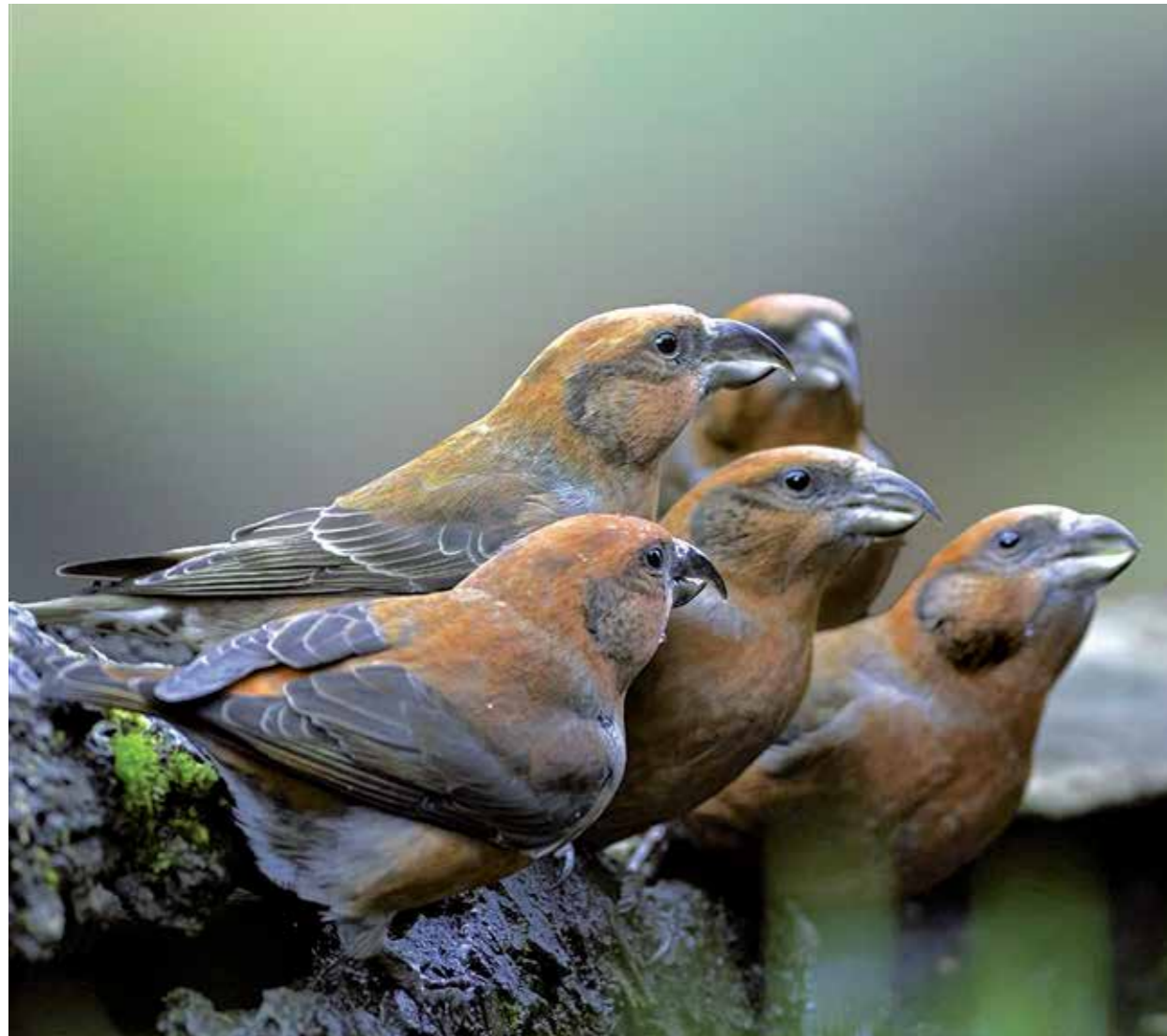
12 KRUISBEK

De grootste aantallen treden op als een goed broedseizoen met veel voedsel en dus veel jongen wordt gevolgd door voedselgebrek in grote delen van het broedgebied. Bij ons aangekomen