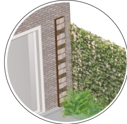
Deze bewoonster maakte zelf een insectenhotel. Vliegende insecten leggen hun eitjes in de holtes.