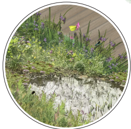
Er is veel leven rondom het water. En daar maken vogels dankbaar gebruik van. Veel vogels voeden hun jongen met kleine insecten. Kleine dieren, zoals kikkers, kunnen onder het verhoogde vlonder door kruipen.