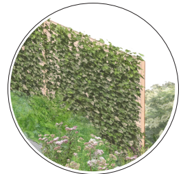
Klimop is een wintergroene en compacte klimplant. Deze plant biedt voedsel en schuilgelegenheid. Verschillende vogels maken graag een nest tussen het dichte gebladerte.