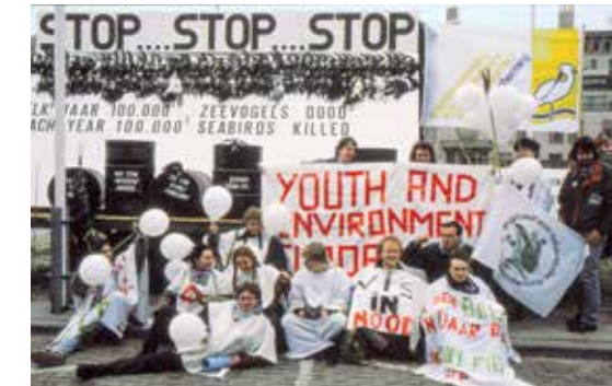
Demonstratie in Den Haag tegen olielozingen op zee in 1990.