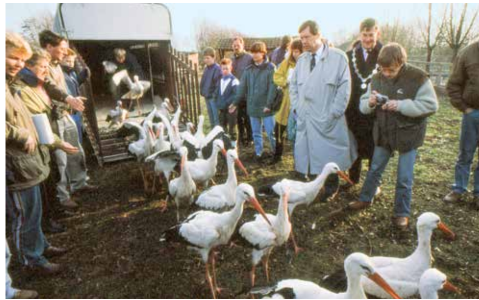
Gestolen ooievaars in 1992 zijn weer terecht.