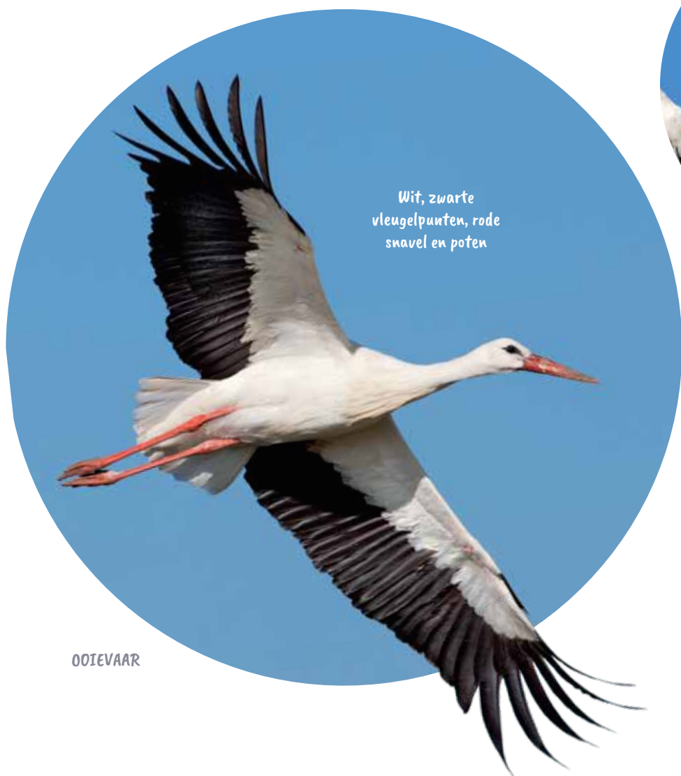
Wit, zwarte vleugelpunten, rode snavel en poten

Als er één soort is die symbool staat voor Vogelbescherming (met een kleine én hoofdletter 'v') dan is het de ooievaar wel. En dan mag ook zijn zeldzamere 'neef' de zwarte ooievaar natuurlijk niet ontbreken. Al is het maar omdat ze beide op trek te zien zijn in voor- en najaar.