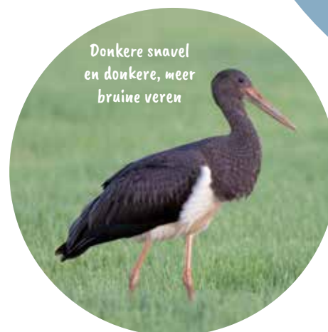
Donkere snavel en donkere, meer bruine veren

De zwarte ooievaar broedt niet in Nederland, maar in Midden-Europa en in delen van zuidelijk Europa tot ver in Azië. Tijdens de trekperiodes, en dan met name in augustus-september, trekken vogels die ten (zuid)oosten van Nederland broeden bij ons door op weg naar Afrika. Meestal gaat het daarbij om eelingen die zich soms wel bij hun witte familiegenoten aansluiten, maar ook groepjes komen