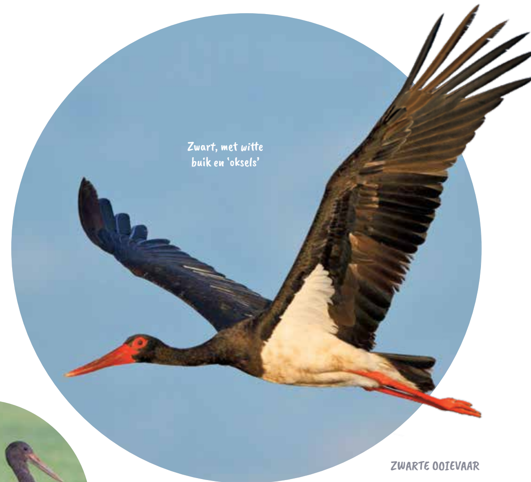
Zwart, met witte buik en 'oksels'

Van dichtbij is de ooievaar op het oog met geen andere Nederlandse vogelsoort te verwarren. De combinatie van een wit verenkleed, zwarte slagpennen, rode snavel en poten maakt de