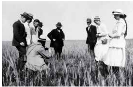
Ledenexcursie naar Texel kort na oprichting.

2024 is het jaar dat Vogelbescherming Nederland 125 jaar bestaat. Een lange periode waarin veel is bereikt voor vogels. Dat heeft Vogelbescherming alleen voor elkaar kunnen krijgen dankzij onze leden, (vogel)vrijwilligers, andere natuurorganisaties, partners en de mensen en partijen die ons met geld steunen. Aan de hand van enkele memorabele momenten nemen we je mee door de geschiedenis van Vogelbescherming.