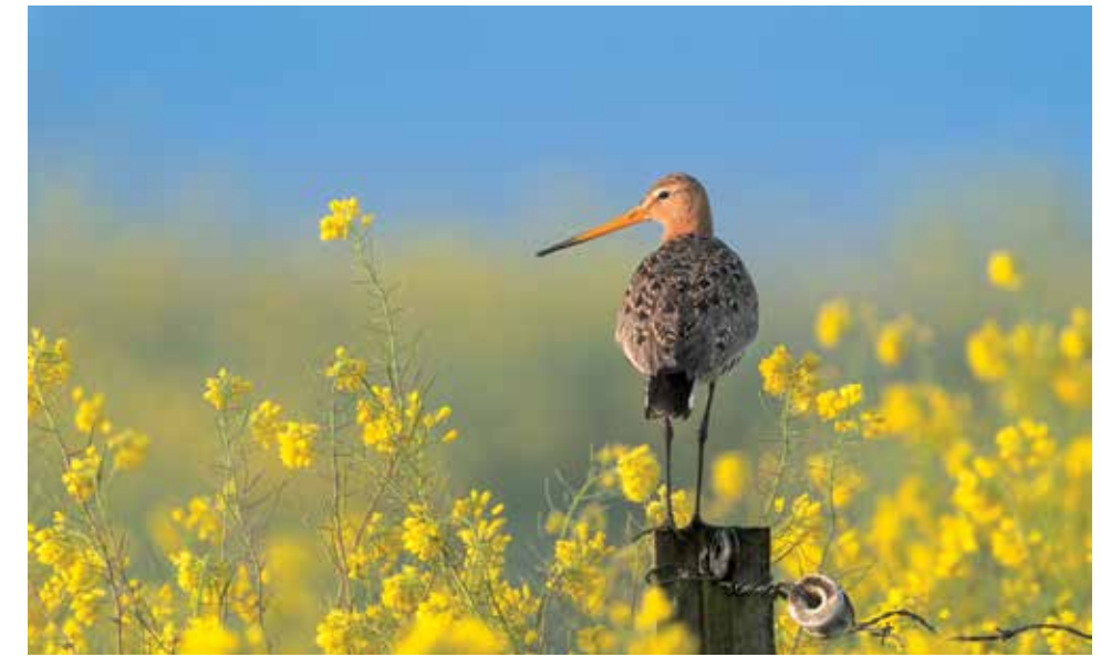
GRUTTO Ton Valk/Buiten-Beeld