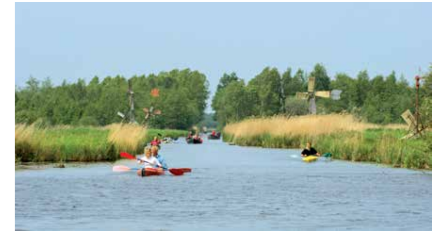
Natura 2000-gebied Loosdrechtse Plassen.