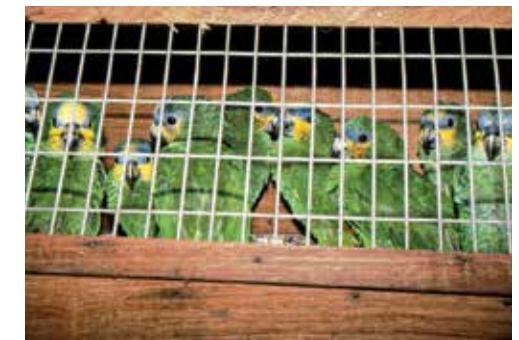
Begin jaren negentig van de vorige eeuw voerde Vogelbescherming actie tegen de internationale vogelhandel.

In het voorjaar van 1935 houdt een vogelwachter van Vogelbescherming in de Zaanstreek een stroper aan. Hij heeft maar liefst 40 illegaal geraapte eieren in de tas. 'Met zulk een voorbeeld voor oogen zullen andere roovers zich niet zo licht meer in het veld wagen' is de hoop en verwachting. Vogelbescherming is decennialang actief geweest met - veelal onbezoldigde - terreinbewakers . Om vogels veilig te kunnen laten broeden en de rust in gebieden te bewaken. Die lijn is door te trekken naar het huidige netwerk van WetlandWachten . Deskundige vrijwilligers die sinds 1995 voor Vogelbescherming waken over de belangrijke waterrijke vogelgebieden in ons land.