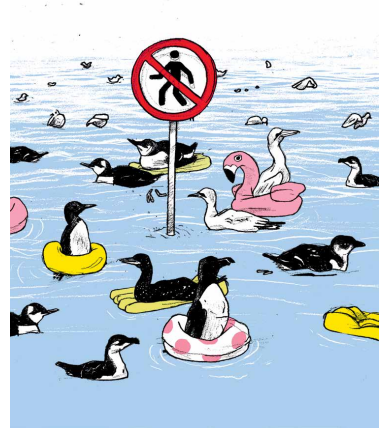
De vogel heeft een recht op bescherming, maar het is de enige manier om de natuur weer dicht te laten komen, juist ook in de zoute wateren. Nederland moet dus ook de zoute wateren strikt beschermen. Het is belangrijk om te zorgen dat de natuur wordt beschermd en dat het milieu wordt hersteld.

Er zijn veel mogelijkheden om de natuur te herstellen en de biodiversiteit te verbeteren. Het is belangrijk om te zorgen dat de natuur wordt beschermd en dat het milieu wordt hersteld. Dit is een uitdaging voor Nederland, maar het is ook een kans om de natuur te herstellen en de biodiversiteit te verbeteren. Het is belangrijk om te zorgen dat de natuur wordt beschermd en dat het milieu wordt hersteld.