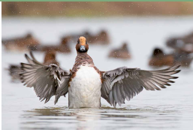
SMIERT Hans Aarden

bedreigde soorten was nabij steden de helft minder. Volgens Holm kan de verminderde beschikbaarheid van voedsel rond steden een oorzaak zijn van het lagere aantal. Bepaalde soorten vogels zoeken hun voedsel niet alleen in het bos, maar ook in de directe omgeving daarvan. Als die omgeving uit bebouwing bestaat, dan zijn er bijvoorbeeld minder insecten beschikbaar. Ook verstoring door geluid en licht spelen een rol. Maar voor sommige vogelsoorten is een stedelijke omgeving juist aantrekkelijk. De appeltrek is daar een mooi voorbeeld van. In steden staan meer fruitbomen dan in natuurlijke bossen. De appeltrek weet dus precies waar hij het beste kan leven.