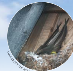
MARGLET DE HOOGHE

Doen: Leg speciale nestdakpannen op het dak. Is het dak goed geïsoleerd? Schuif dan het vogelschroot op naar een hogere panlat of kies voor inmetsele kasten.